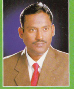
గ్రంథి బంధ్రమాశేష్యరంపు మేనేజింగ్ పార్టనర్