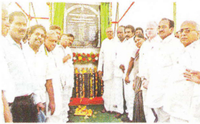
కొండపేటలో ఇన్ఫాస్ ఆధ్వర్యంలో అభివృద్ధి పనులకు శంకుస్థాపన చేస్తున్న సి ఎం రోజయ్య

(అవధిత - గుంటూరు) గుంటూరు-చిలకలూరిపేట మధ్య జూబిలీ రోడ్ కలవరం వల్ల ప్రజలకు తీవ్ర అవకాశం కల్పించిన సందర్భంగా సాగునీరు అందుతున్న రోడ్లకు ఈ రహదారి కేటాయింపు